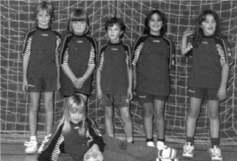
Die weiblichen Minis der Saison 1999/2000:

Seit Oktober 1999 trainiere ich unsere Mini-Mädchenmannschaft. Es ist toll, dass alle Spielerinnen mit sehr viel Eifer dabei sind, das Handballspielen zu lernen. Ständig sind hier Fortschritte zu verzeichnen. Im Vordergrund des Trainings steht, dass die Mädchen Spaß am Spielen mit dem Ball haben und ein Spielverständnis für den Handballsport entwickeln. Außerdem soll durch unterschiedliche Koordinationsübungen ihre Beweglichkeit geschult werden. Ich hoffe, sie so vom Spiel begeistern zu können. Nach einem Turnier, das vor Saisonbeginn ausgetragen wurde um die Minis je nach Spielstärke in zwei Gruppen einzuteilen, wurde die Mannschaft der Gruppe 2 zugeordnet.