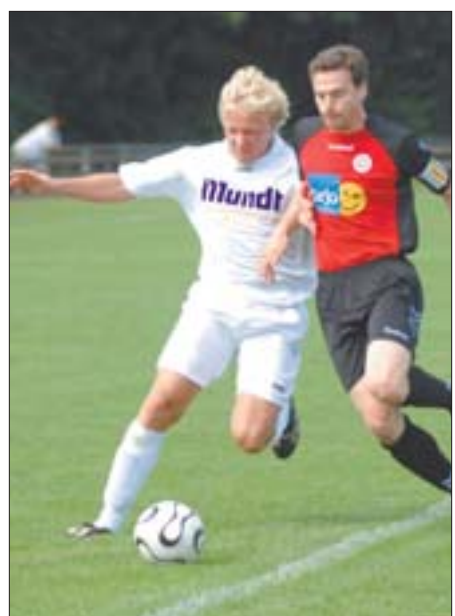
Bloß nicht abdrängen lassen: Der SV Lengede (weißer Dress) will in Osterode kämpfen. im

Fußball-Bezirksoberriga: Ausfallliste bei Aufsteiger Lengede wird immer länger