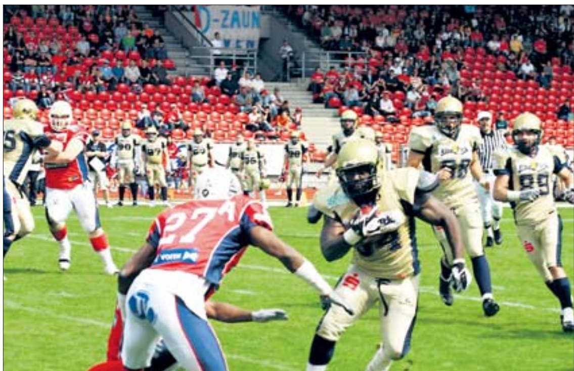
Ein Bild der Vergangenheit: Die Westtribüne (hinten) wird bei den Lions-Spielen künftig leer bleiben.