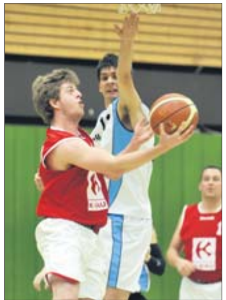
Versuchter Korbleger im Derby: Der Vechelder (rotes Trikot) zieht zum Brett, der Vöhrumer versucht den Wurf abzuwehren.

Doch im dritten Abschnitt änderten die Gastgeber ihr taktisches Konzept und erhöhten die Führung Punkt um