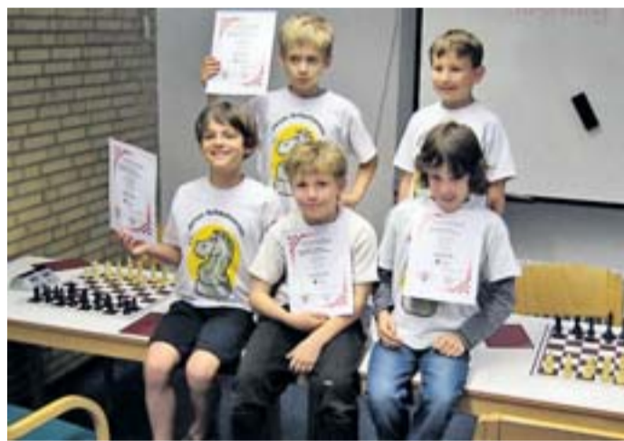
Das U10-Jugend des Peiner Schachvereins.

Jugendteam des Peiner Schachvereins erreicht fünften Platz bei den Landesmannschafts-Meisterschaften